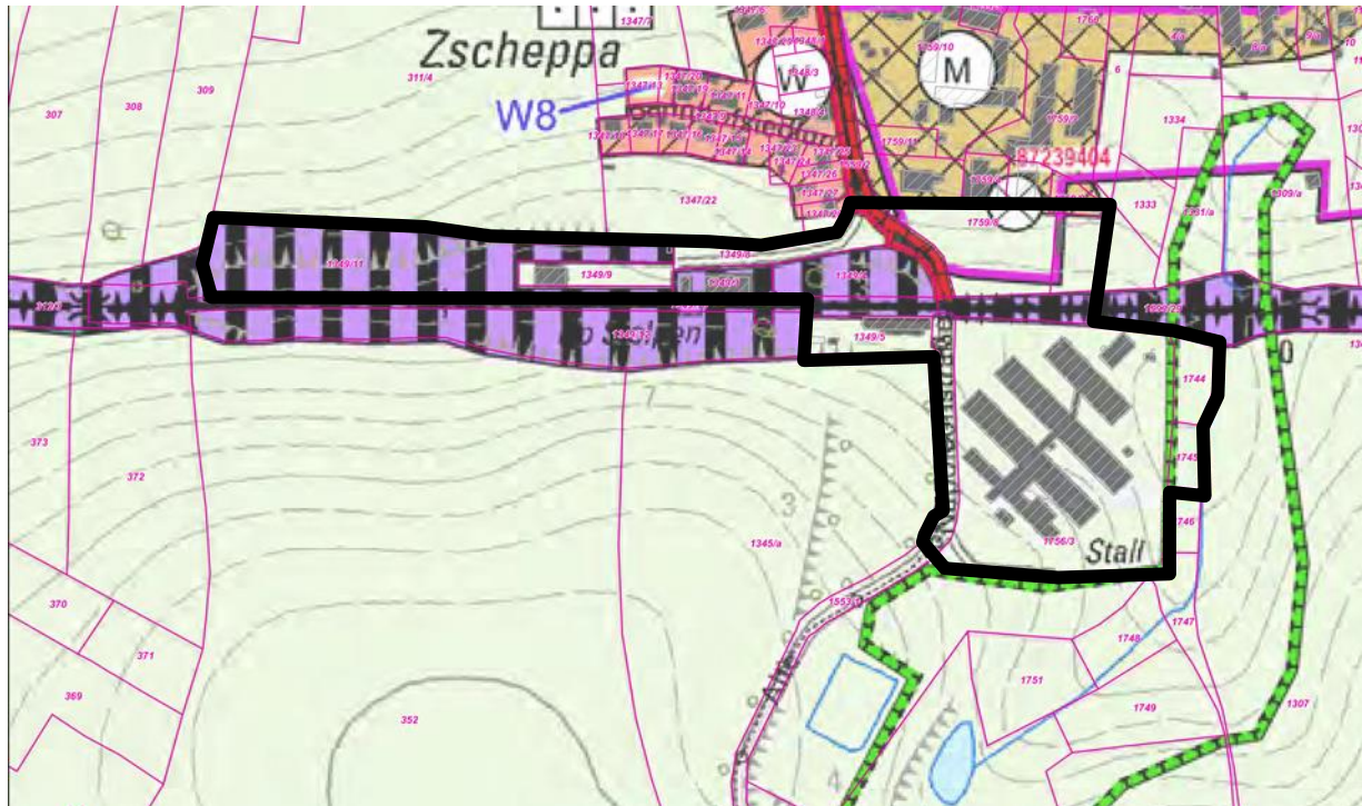
Abbildung 2: Ausschnitt Flächennutzungsplan mit Darstellung des Geltungsbereiches

wird. Dabei wird auch die Darstellung der Gleisanlagen (violett) dem aktuellen Stand angepasst. Die bisherige Darstellung der Gleisanlagen im Flächennutzungsplan entspricht mittlerweile nicht mehr den tatsächlichen Ausdehnungen.